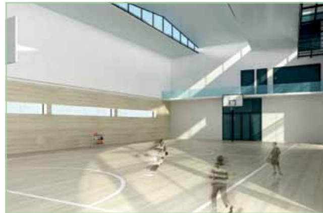
Спортзал - $350,000