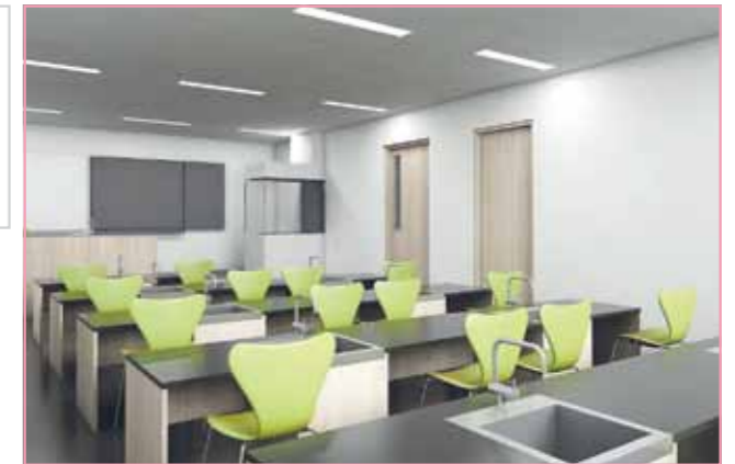
Лаборатории физик/астрономии и химии/биологии