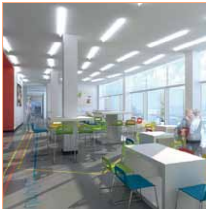
Кафетерий - $150,000