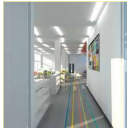
Главная улица - $55,000