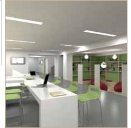
Библиотека - $75,000